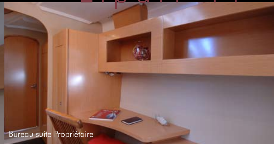
Bureau suite Propriétaire