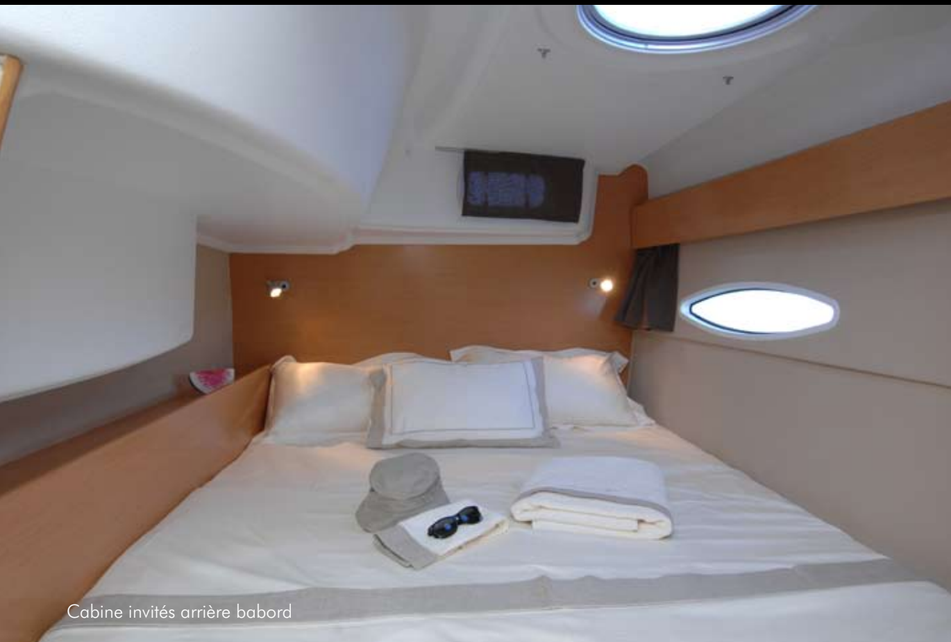
Cabine invités arrière babord