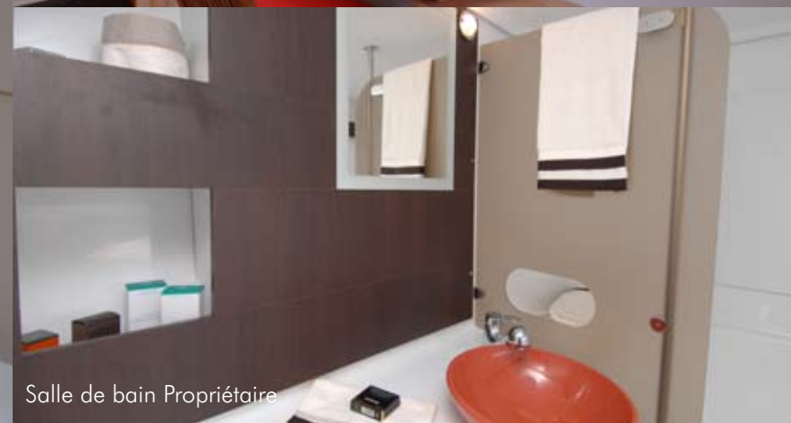
Salle de bain Propriétaire